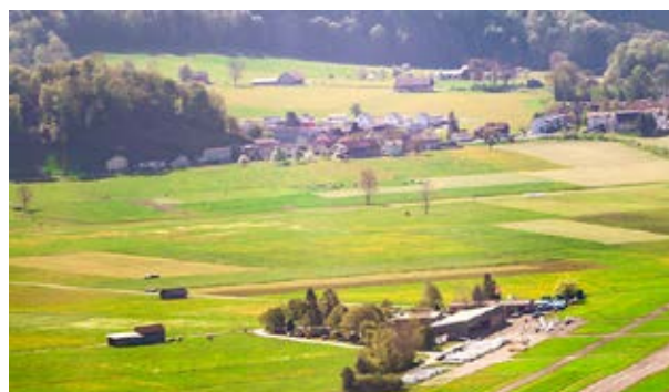
Flugplatz Schänis