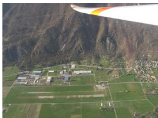
San Vittore