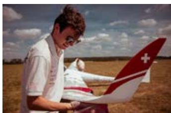
Tizian Steiger